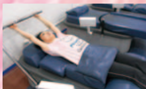
肩、肩甲骨周辺のストレッチング & マッサージ。血行促進し、肩周りの筋肉もほぐしてくれます。

最近では運動だけではなく「いやし」を求めて入会する方が増えています。エースワンには肩、腰、脚の疲労を取るマッサージ機器が多数あり、これだけを行ってリラックスして帰られる方も少なくありません。ストレッチブースもあり、運動が苦手な方、運動から遠ざかっていた方の、体づくりとして取り入れる方が増えています。体を柔軟にすることは健康づくり第一歩です。お気軽に始めてみませんか?