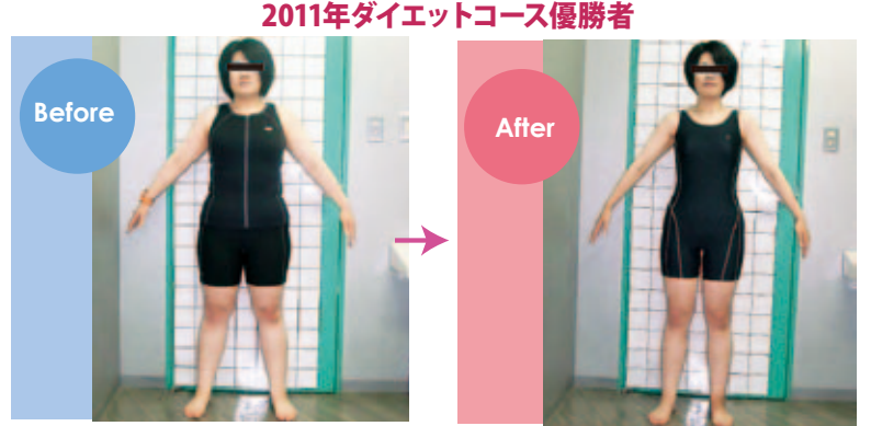
2011年ダイエットコース優勝者