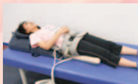
空気圧により新しい血流の還流を促し、体内部からリフレッシュさせます。