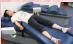
骨盤の位置調整と腰部、殿部の血行を促進し、ウエストのくびれを作りやすくします。老化防止にも役立ちます。